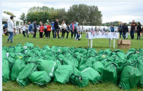
A gyerekpályán