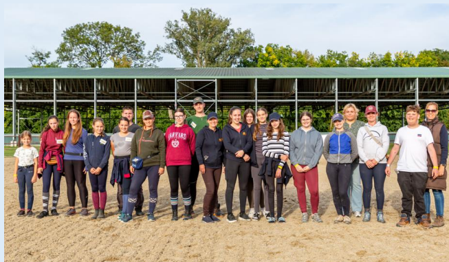
A fotón a lovasapródok láthatóak.

A verseny lebonyolítását 70 önkéntes segítette. A Magyar Lovassport Szövetség Lovas Apród programja keretében 14 lelkes fiatal segítette a verseny gördülőkegely lebonyolítását, eközben hasznos tapasztalatokat szereztek a nemzetközi és a nemzeti díjlovas verseny lebonyolítási feladataiban.