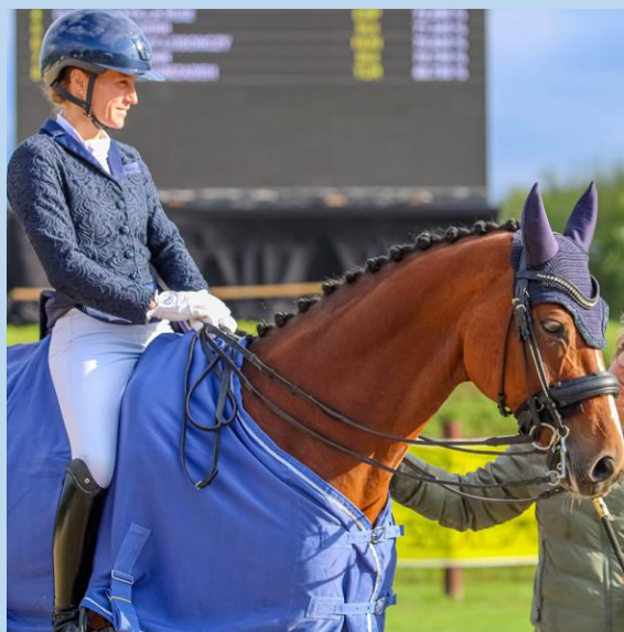
A képen: Helen Langehanenberg

Telekom Nagydíj (Világkupa) győztese: Helen LANGEHANENBERG (Németország), lova: FACILONE FRH.