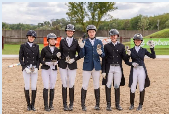
A képen: A díjlovasok csapata